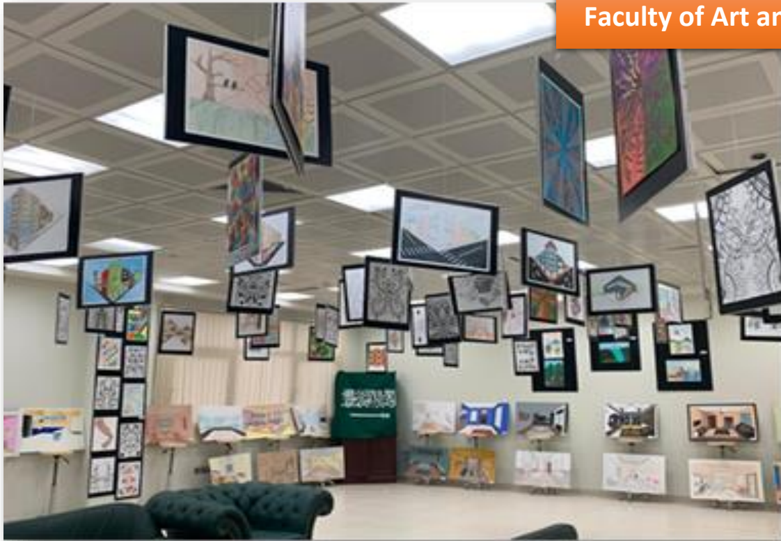
Faculty of Art and Design