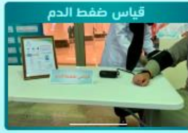
قياس ضغط الدم