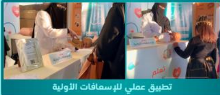
تطبيق عملي للإسعافات الأولية