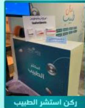
ركن استشر الطبيب